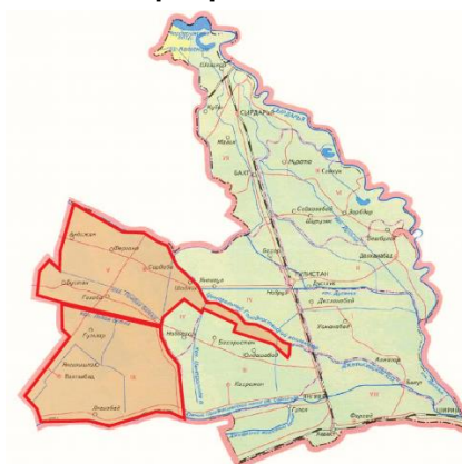
Харита 1.2: Лойиҳанинг амалга оширилиш жойи – Сирдарё вилояти