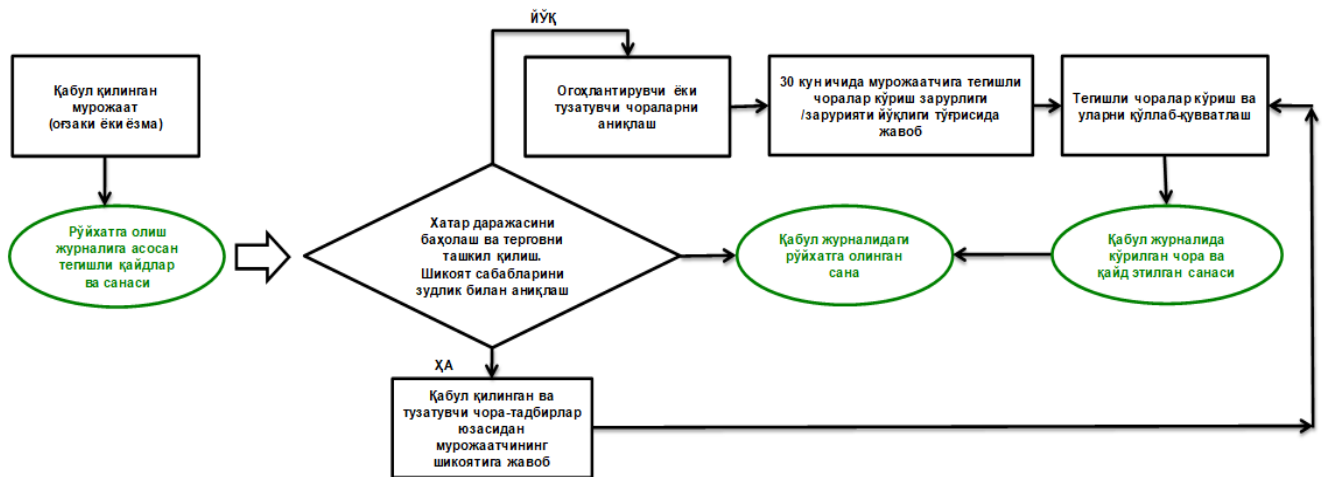
Расм6.1: Шикоятларни кўриб чиқиш учун жадвал