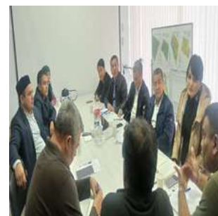
Юқоридаги фотосуратлар: маҳаллий ҳамжамият ва МФЙ раиси билан "Индорама Агро" учрашуви.