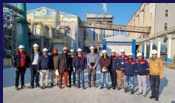
Юқоридаги фотосуратлар: Unique Land Use GmbH ташкилоти жамоаси 2022 йил ноябр ойида Индорама Агро объектларига мавжуд фермерлик фаолияти билан танишиш учун ташриф буюриди.