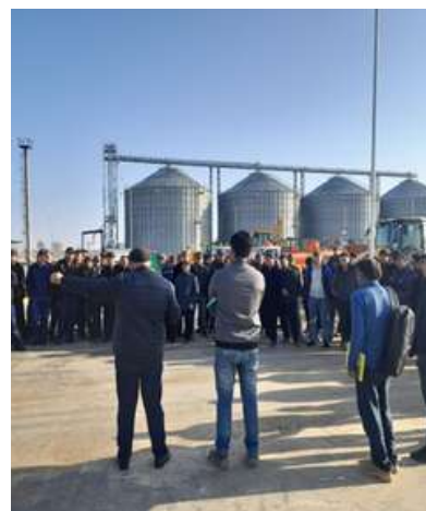
Расм маркази: Arendam Венерји ва ходимлар булими дан Матлуба хоним Тоировда касаба уюшмаси билан суҳбатлашишди; сурат: Қашқадарёда давом этаётган дала текшируви пайти.