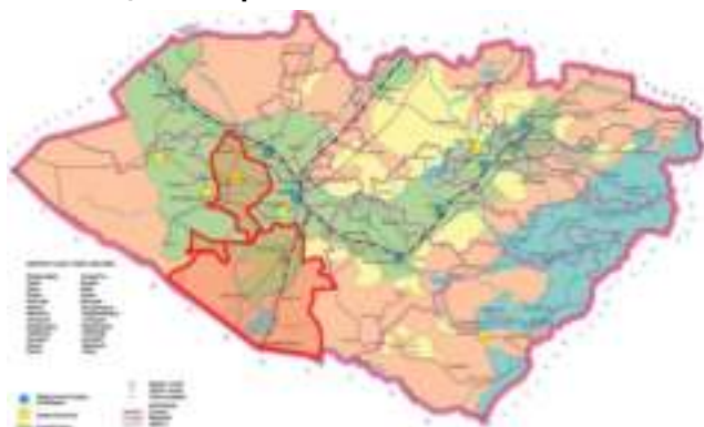
Харита 1.1: Лойиҳанинг амалга оширилиш жойи – Қашқадарё вилояти