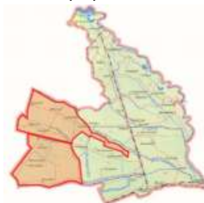
Харита 1.2: Лойиҳанинг амалга оширилиш жойи – Сирдарё вилояти